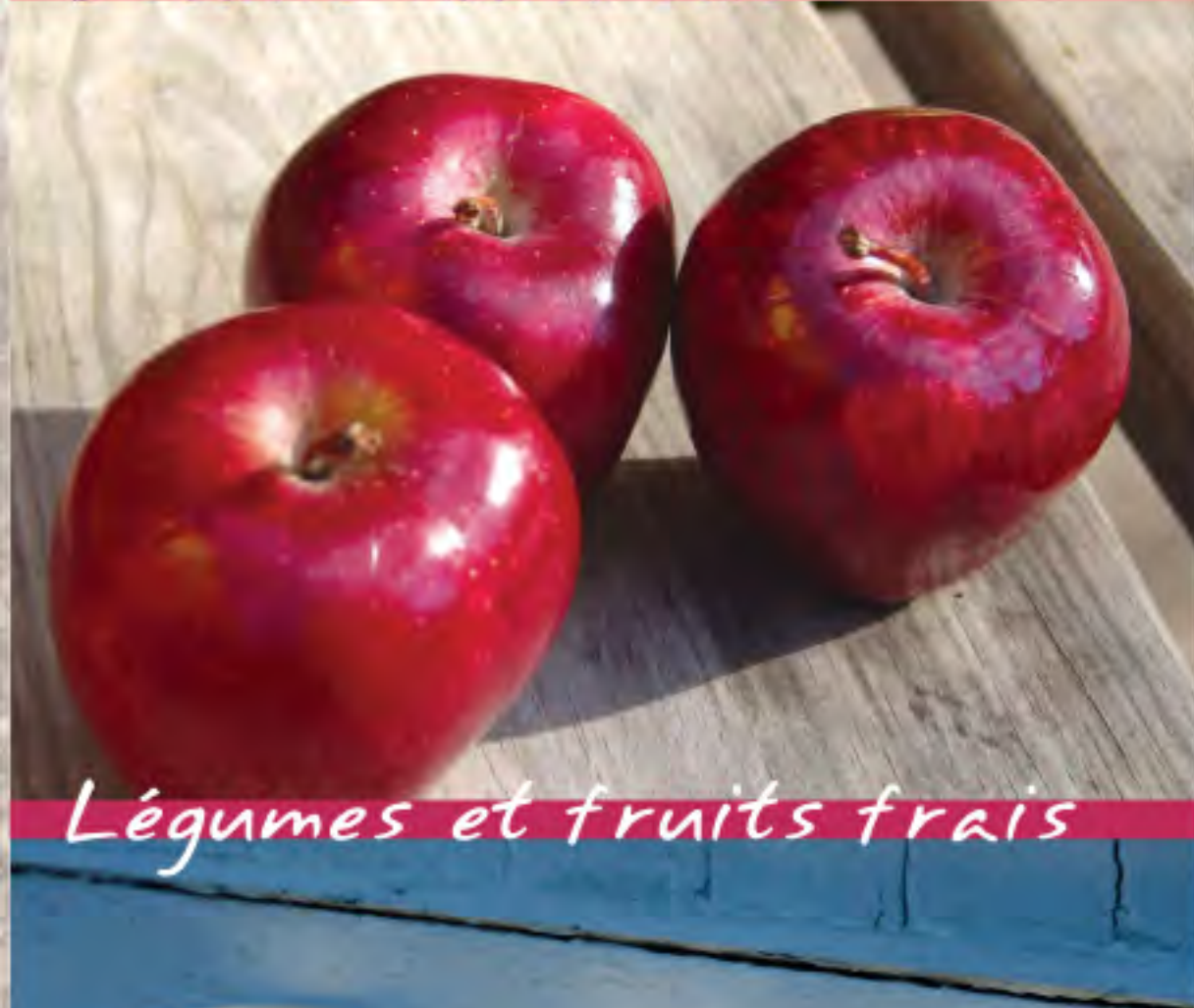
Légumes et fruits frais