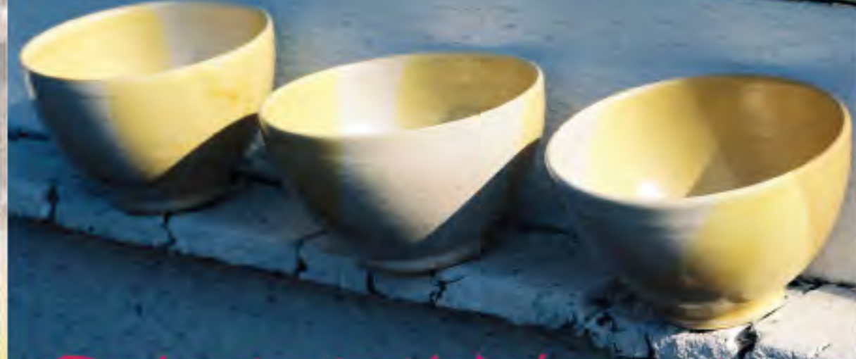
Poterie fait à la main

4950, chemin Heath, route 143 Stanstead PQ J0B 3E0 819-876-2817 info@vergerheathorchard.com Nous sommes ouverts tous les jours de 9h au coucher du soleil, entre les mois d'août et novembre, et les fins de semaine jusqu'à Noël. Les légumes saisonniers et la poterie sont disponibles au mois de juillet (appelez pour les heures d'ouverture).